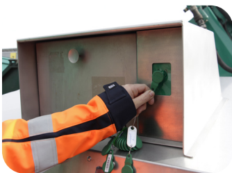
1. Transponder vor das Lesefeld halten