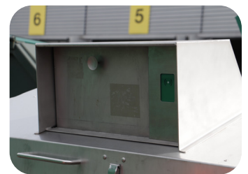
4. Müllbeutel 15 Liter einwerfen und Klappe schließen

Jedem Haushalt wird eine Mindesteinwurfzahl pro Jahr entsprechend der Haushaltsgröße mit dem Gebührenbescheid berechnet. Diese Gebühr setzt sich zusammen aus: