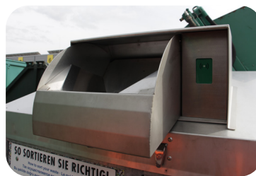
3. Einwurfsklappe öffnen